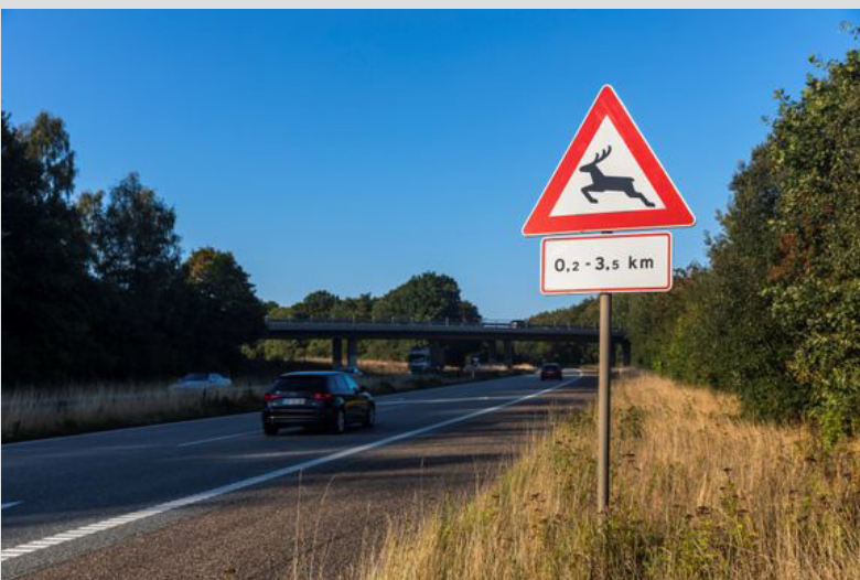
Trafikanter skal være mere opmærksomme på vilde dyr, når de ser hjorte-skiltet.

”Man skal altid være opmærksom på dyr på vejen og derfor er det en vigtig kampagne. Mange tusinde dyr bliver hvert år påkørt i trafikken og det kan både skabe farlige situationer for trafikanterne og påføre dyrene lidelser. Er uheldet ude, er det vigtigt at reagere hurtigt og få tilkaldt hjælp, der kan finde dyret og afhjælpe dets lidelser”.