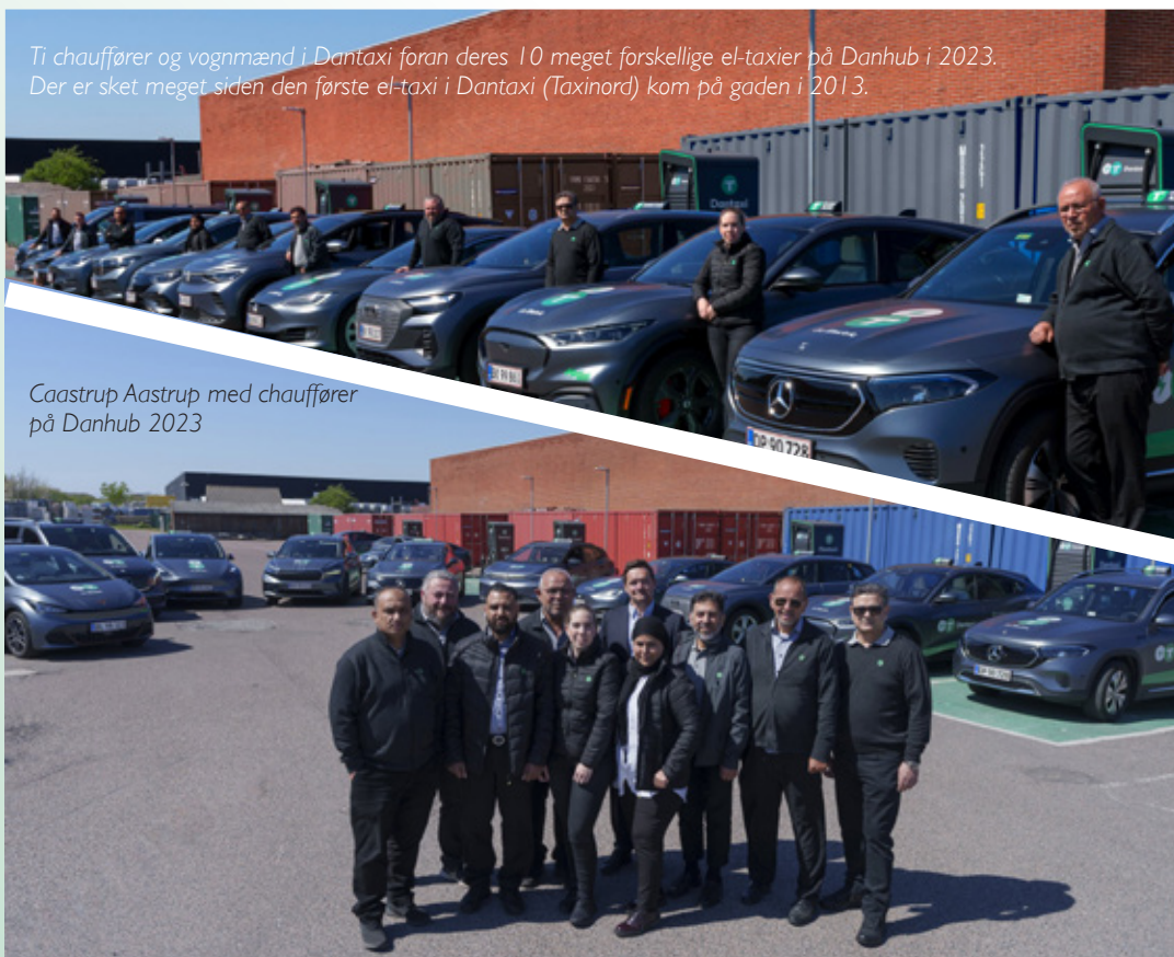
Caastrup Aastrup med chauffører på Danhub 2023

Ti chauffører og vognmænd i Dantaxi foran deres 10 meget forskellige el-taxier på Danhub i 2023. Der er sket meget siden den første el-taxi i Dantaxi (Taxinord) kom på gaden i 2013.