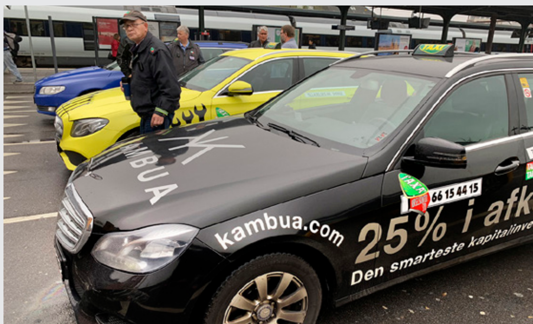
Siden den nye taxilov kom i 2018 har der bl.a. været en meget effektiv kontrol og registrering af hvem, der kører taxierne samt hvor, hvornår og hvor meget. (Arkivfoto fra Odense Banegård)

Kørselskontoret skal indberette, hvor mange forskellige førere der