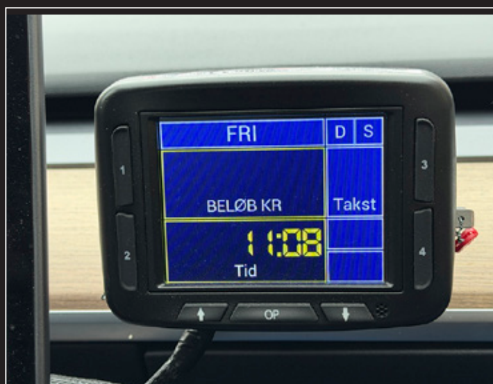
Digitax Taximeter F4 samt printer.