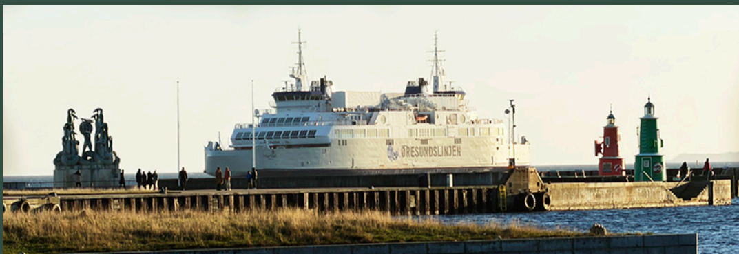
Færgen Hamlet har været på værft i Landskrona, hvor færgen er blevet konverteret til batteridrift.

Det var nødvendigt at strække opholdet i dok med yderligere nogle uger, så alle dele af konverteringen til batteridrift kunne blive gjort færdig. Nu venter det sidste arbejde med opsætningen af færgens nye batterier, som forventes klar til at levere strøm til maskinerne her i begyndelsen af det nye år.