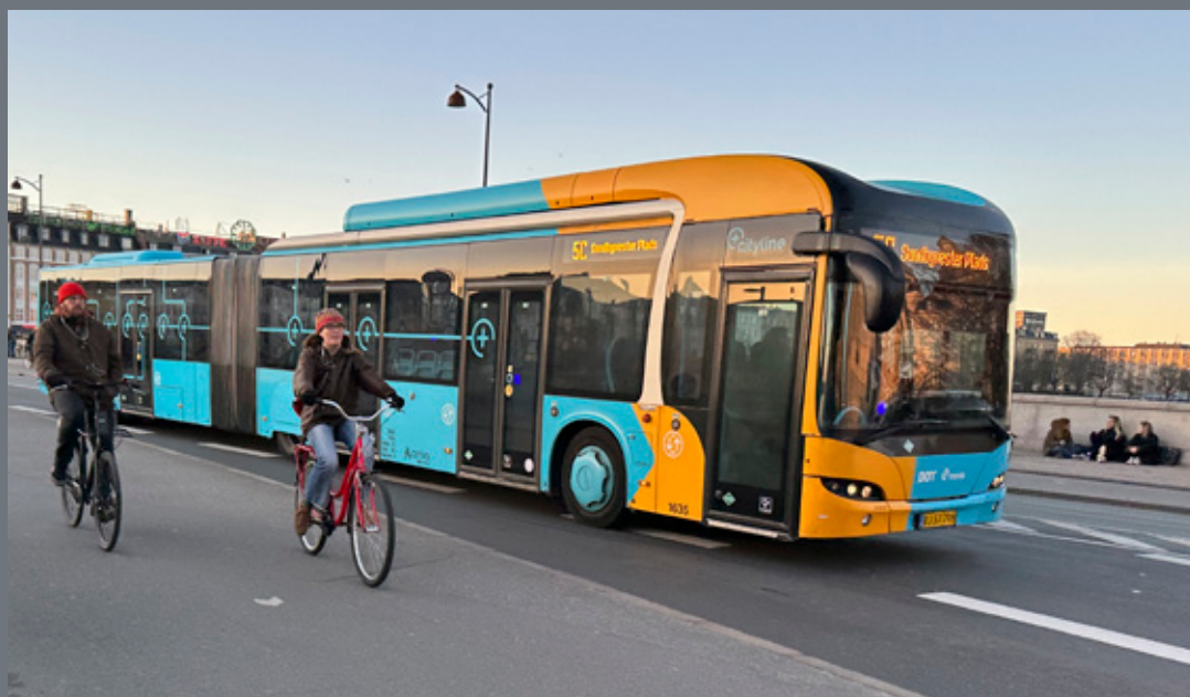
En af Nordens travleste busruter – den ikoniske 5C har siden 2017 anvendt biogas, men er overgået nu til el på lige fod med de øvrige buslinjer i København. Ved driftsforstyrrelser og særkørsler kan kørslen fortsat udføres af dieselbusser, indtil hele vognparken er udskiftet.

Med omlægningen sparer Københavns Kommune klimaet for i alt cirka 14.700 tons CO2 om året. Derudover udleder de hverken NOx (såkaldte kvælstofilte) eller partikler fra motoren, hvilket bidrager til en bedre luftkvalitet i byen.