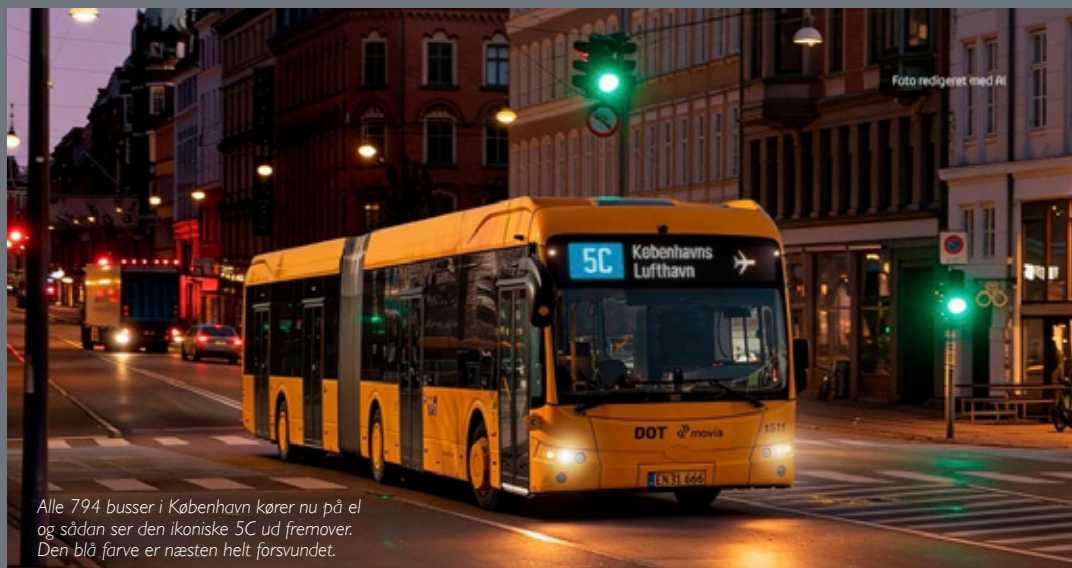
Alle 794 busser i København kører nu på el og sådan ser den ikoniske 5C ud fremover. Den blå farve er næsten helt forsvundet.